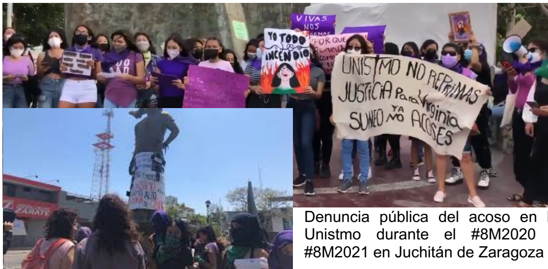
Denuncia pública del acoso en la Unistmo durante el #8M2020 y #8M2021 en Juchitán de Zaragoza

Es de llamar la atención de especialistas en procesos democráticos, internacionalistas, colectivas y feministas, todo el despliegue que se ha hecho de los recursos públicos destinados a la educación durante treinta años, ahora echados a andar para proteger a dos imputados por el delito de acoso sexual contra alumnas en la carrera de derecho del campus Ixtepec. Las preguntas son muchas, pero empecemos por un par de ellas: