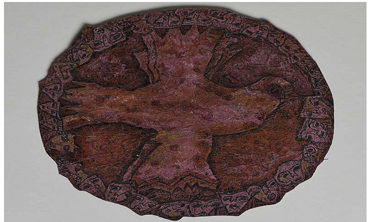
(Figura 5): “Un pájaro volador”.

Una de las obras artísticas más recientes de Khayat, titulada “Un pájaro volador” (figura 5), muestra un lienzo circular que él mismo confeccionó, donde un pájaro aparece meticulosamente ilustrado con acuarela y tinta. Entre estos elementos se entrelazan innumerables detalles intrincados, en los que se yuxtaponen numerosos rostros expresivos y se entretajan diminutos garabatos. Empapada en un vívido tono rojo, esta obra personifica la metodología artística posterior de Khayat, que armonizaba elementos de imágenes naturales, paisajes y representaciones de figuras humanas. Explorador frecuente de los paisajes naturales y urbanos de Kurdistán meridional, se inspiró en estas experiencias y reconfiguró posteriormente los diversos