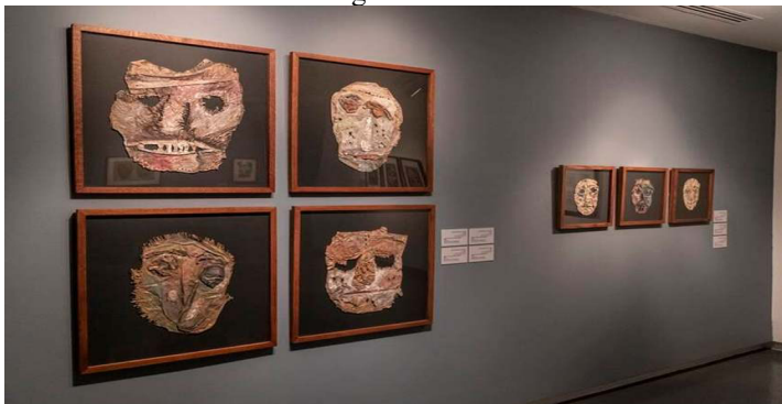
(Figura 2): “Máscaras”, de Ismail Khayat.

Ismail Khayat (1944-2022) se erigió como emblema supremo de las artes plásticas no sólo dentro de Irak en general, sino con especial significación en el ámbito de Kurdistán. El concepto de “arte plástico” tiene su origen en el término “plastificar” o “moldear”, y esencialmente implica describir “cualquier forma de arte que implique la actividad de modelar o moldear en tres dimensiones”. El ejemplo más común de arte plástico es la propia escultura. La influencia de Khayat impregnó el panorama artístico iraquí y ocupó un lugar aún más destacado dentro del paisaje artístico de Kurdistán. Se le considera el artífice del lenguaje visual moderno en el ámbito del arte plástico kurdo. Al principio, su trayectoria artística se ciñó a las normas del discurso imperante dentro del arte plástico, haciéndose eco de la trayectoria seguida por muchos artistas de su generación. Pero muy pronto se embarcó en una búsqueda de alternativas, una exploración que se nutrió del fértil entorno kurdo y que posteriormente le condujo a su evolución artística. Tras ingresar en la Sociedad de Artes Plásticas Iraquíes, en 1965, Khayat se licenció en la Escuela de Magisterio de Baquba, en 1966. En 1992, asumió el cargo de director artístico del Ministerio de Cultura de la región de Kurdistán.