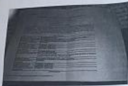
Foto información oficial licitación obra

1. Antes de que las Instituciones Gubernamentales inicien alguna intervención en la infraestructura física o social de los pueblos originarios, es preciso que la autoridad convoque a una Consulta para obtener el beneplácito o el rechazo de dicha intervención